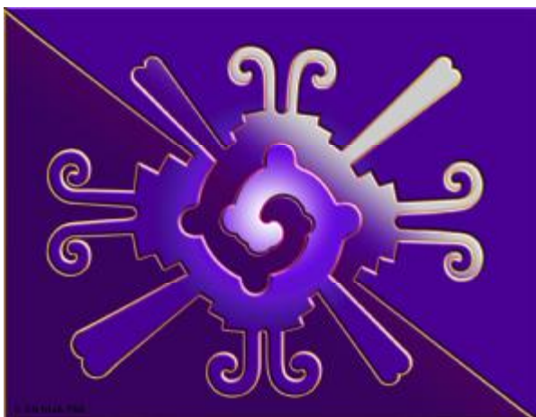
Hunab Ku - © by Annijatbé

Plötzlich stellt sich also das „Falsche“ als das heraus was es eben ist - nämlich falsch - als eine weitere Manipulation und nichts anderes. Die Phänomene habe es mir gezeigt und mich bis zum heutigen Tag eine alte Arbeit mit dem Falschen nicht fertigmachen lassen.